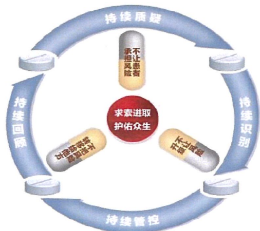
以“求索进取 护佑众生”为使命的药品质量风险管控模式

风险无处不在。公司做什么?做到“四持续”:持续质疑、持续识别、持续管控、持续回顾。