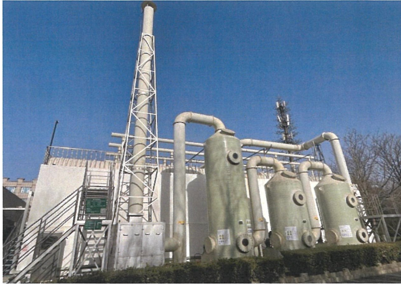
污水站废气处理装置